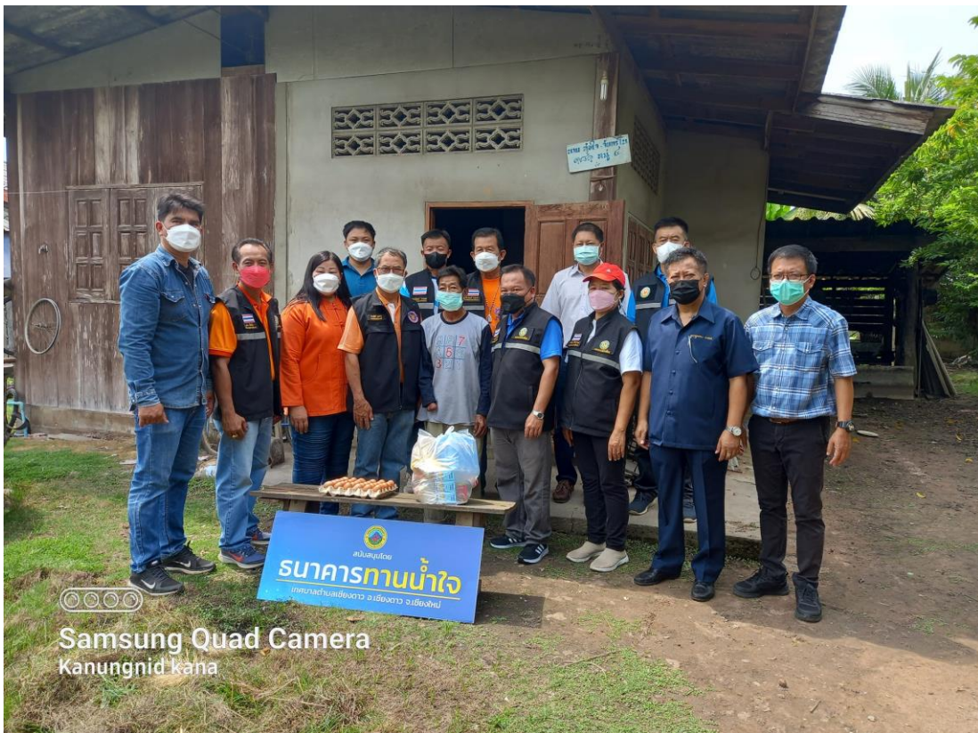
📷📷📷 Samsung Quad Camera Kanungnid kaha