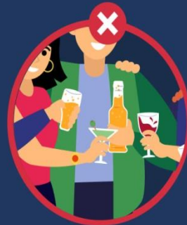
การปาร์ตี้และ ดื่มสุราร่วมกัน