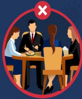
ทานอาหาร ร่วมกับเพื่อนร่วมงาน