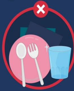
ใช้ภาชนะร่วมกัน