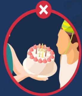
การเป่าเค้ก