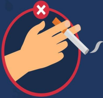
สูบบุหรี่รวมคนเดียวกัน